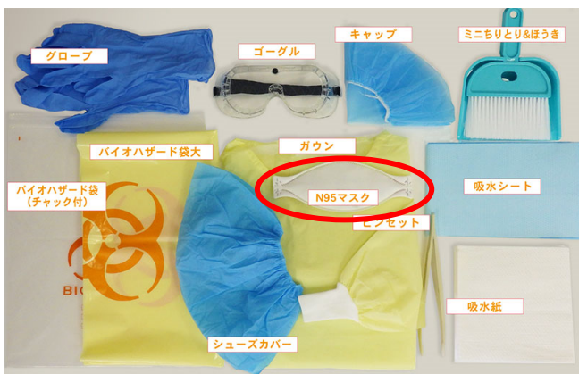
簡易スピルキット

お客様には、ご不便、ご迷惑をお掛けいたしますが、何卒ご了承くださいますようお願い 申し上げます。